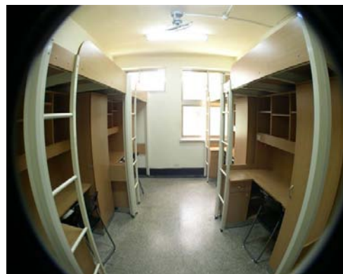
大倫館寢室內部設施