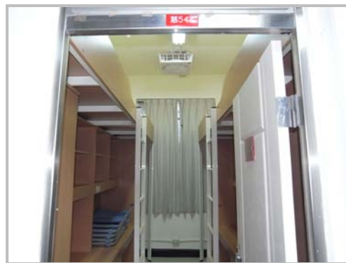
大慈館寢室內部設施