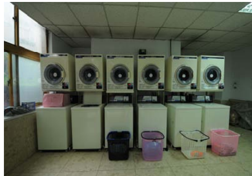
大莊館自助投幣式洗、烘衣機