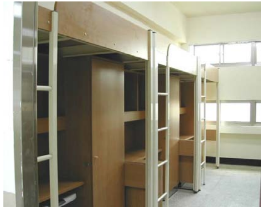
大雅館寢室內部設施